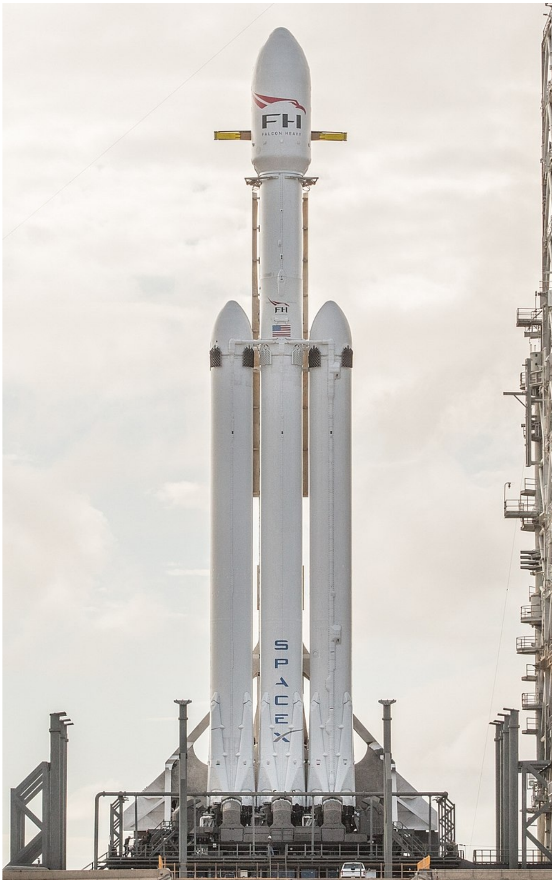
Figure 2. This is an image.

vulputate velit esse molestie consequat, vel illum dolore eu feugiat nulla facilisis at vero eros et accumsan et iusto odio dignissim qui blandit praesent luptatum zzril delenit augue dui dolore te feugait nulla facilisi. Nam liber tempor cum soluta nobis eleifend option congue nihil imperdiet doming id quod mazim placerat facer possim assum.